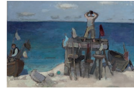
Hermann Bachmann: Am Meer, um 1950, Öl auf Leinwand, 43 x 63,5 cm, Kulturstiftung Sachsen-Anhalt, Kunst- museum Moritzburg Halle (Saale), Foto: Punctum/Bertram Kober © Nachlass Hermann Bachmann

Im Streit reißen Gräben auf. Alle Menschen sind verschieden; gerade deshalb streiten sie sich. Um diesen Unterschieden gerecht zu werden braucht es eine Kultur im Umgang, kurz, eine Streitkultur, die bei der Überwindung dieser Gräben hilft. Mit Streitkultur entsteht Zusammenhalt.