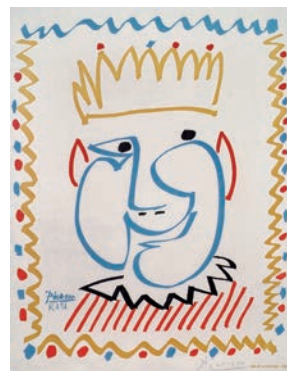
Pablo Picasso „Tête de Roi“, 1951, Farblithographie, ©Succession Picasso, VG Bild-Kunst, Bonn 2023.